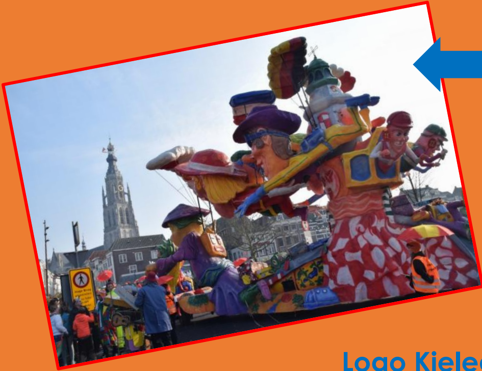
De Stad Breda Kielegat